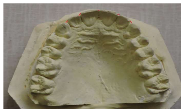
تصویر ۲- محل‌های مورد نظر برای محاسبه شاخص بی نظمی

به منظور ارزیابی پایایی و توافق درون‌مشاهده‌گر، دو هفته پس از پایان دوره پیگیری ۹ ماهه (T3) از ۱۵ بیمار به صورت تصادفی مجدداً قالب گیری انجام شد. کست‌های تهیه شده بار دیگر توسط پژوهشگر اصلی مورد اندازه گیری قرار گرفت و تمامی متغیرهای مورد مطالعه شامل اورجت، اوربایت، طول قوس، عرض بین کانیینی، عرض بین مولری و شاخص بی نظمی مجدداً ثبت شدند. به منظور تعیین میزان خطای اندازه گیری و بررسی توافق مشاهده‌گر، ضریب همبستگی درون‌طبقه‌ای (Intraclass Correlation Coefficient; ICC) محاسبه شد که مقدار آن بیش از ۰/۹۶۰ به دست آمد و بیانگر پایایی بسیار مطلوب اندازه گیری‌ها بود.